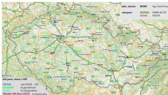
přehled vybraných permanentních stanic GNSS a jejich sítí (k 1.7.2017)